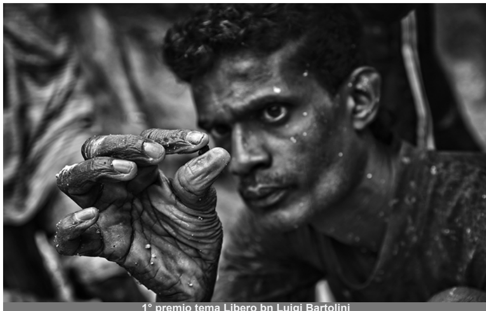
1° premio tema Libero bn Luigi Bartolini