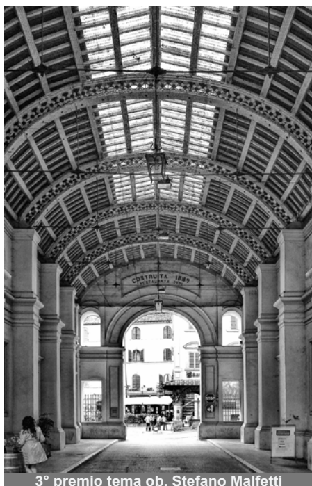
3° premio tema ob. Stefano Malfetti

Foto BN Alloro Francesco e Pastorino Giovanni, Foto a Colori Colapinto Nicola e D'Eramo Umberto, Foto "Angoli di Anghiari" Paravani Claudio e Piccioli Eugenio.