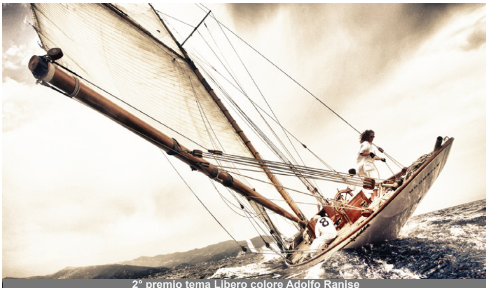
2° premio tema Libero colore Adolfo Ranise