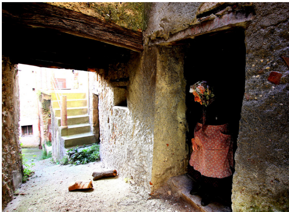
Secondo Premio Luigi Curti