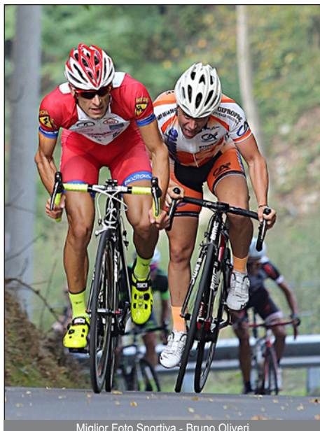
Miglior Foto Sportiva - Bruno Oliveri