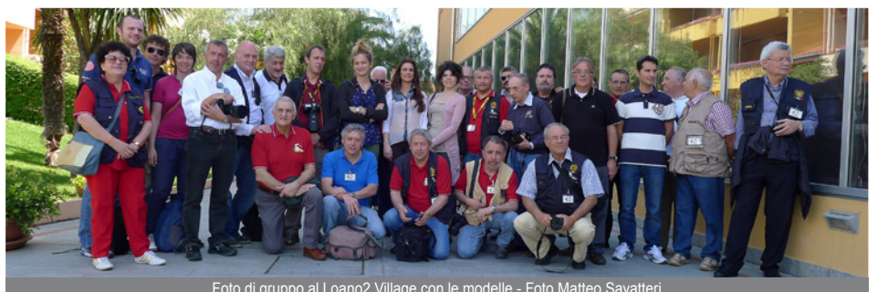
Foto di gruppo al Loano2 Village con le modelle