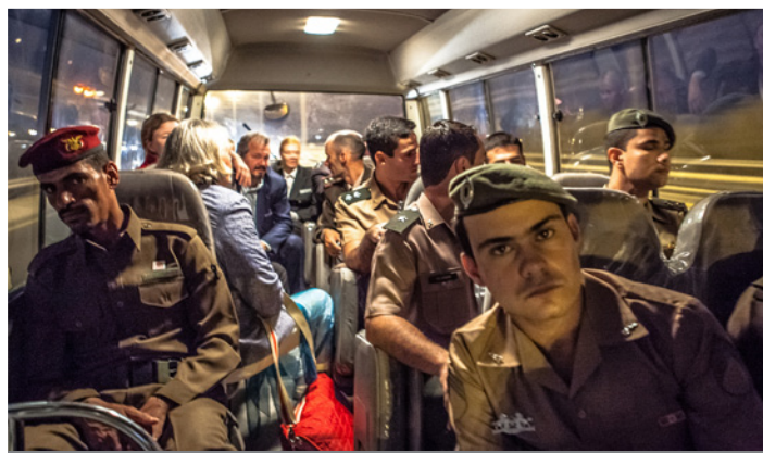
Premio Speciale Figura ambientata Alberto Diodato