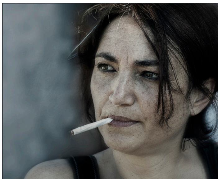
Premio Speciale Ritratto Marca Barone