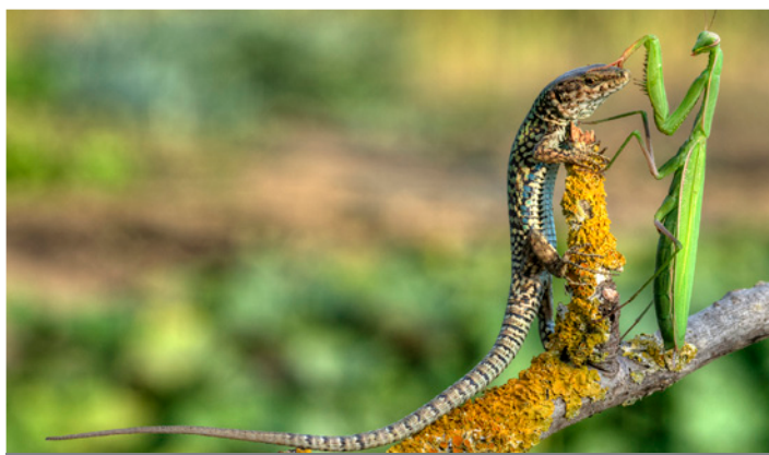
Segnalazione Azelio Magini