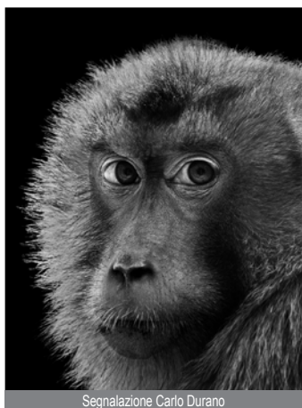
Segnalazione Carlo Durano