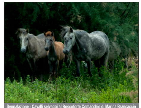
Segnalazione - Cavalli selvaggi al Boscoforte Comacchio di Marina Brancaccio