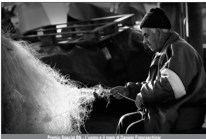
Premio Special BN - L'uomo e il mare di Daniele Franceschini