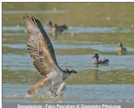
Segnalazione - Falco Pescatore di Giampietro Pittalunga