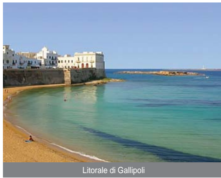
Litorale di Gallipoli