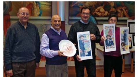
Cerimonia di Premiazione