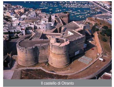
Il castello di Otranto