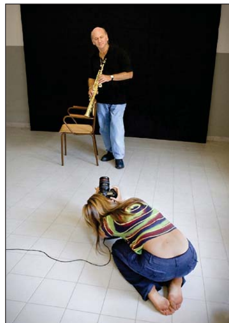
Giulia Berardi fotografa il grande jazzista David Liebman

ti intorno alla modella che inscenava per loro pose pseudo-sexi: una serie di click compulsivi riempiva la stanza e nessuno sapeva più quale fosse il proprio spazio vitale, nessuno faceva attenzione alle luci, ai fondali... così ho preso le distanze da tutto ciò e ho trovato il mio punto di vista fotografando soltanto i fotografi impazziti; è stato più divertente per me... a volte è utile saper trovare nuovi punti di vista! Gli episodi sarebbero tanti, molti legati comunque alla bellezza del fotografare le persone stabilendo con loro un legame. Per un anno, nel 2008, sono andata una volta alla settimana a fotografare le prove di una compagnia di teatro formata da persone della terza età. Ci sono state delle volte in cui non riuscivo a scattare per colpa della troppa emozione di fronte al loro impegno e alla loro intensità. Il mio esercizio si è concluso con la visione collettiva di un video fotografico "Metti un martedì a teatro" in seguito al quale ho ricevuto una carica di energia umana incommensurabile che ancora mi commuove. Gli attori e le attrici hanno voluto scrivere un piccolo brano di presentazione del video e hanno