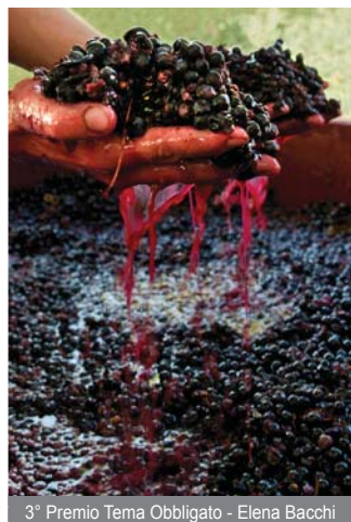
3° Premio Tema Obbligato - Elena Bacchi