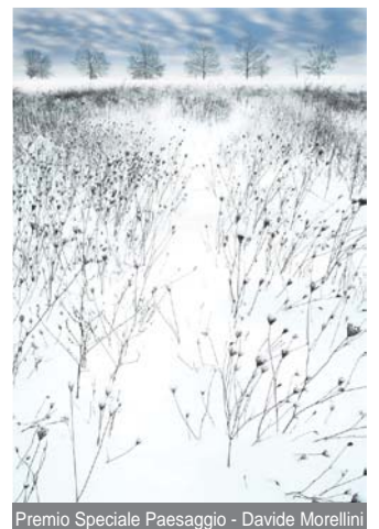
Premio Speciale Paesaggio - Davide Morellini