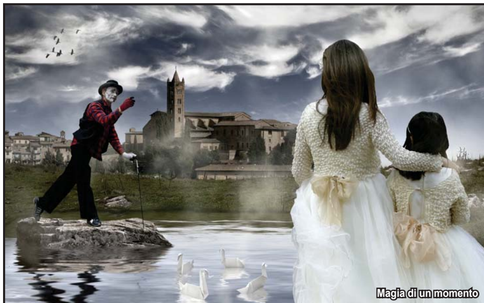
Magia di un momento