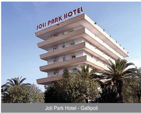
Joli Park Hotel - Gallipoli