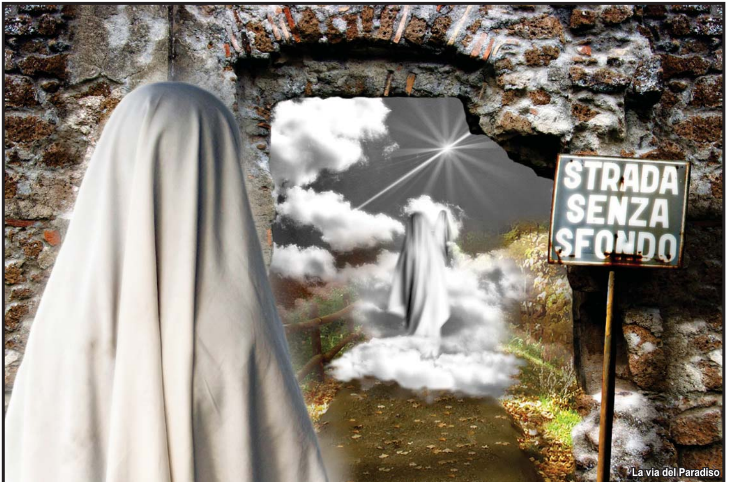
La via del Paradiso