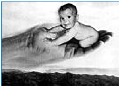
"Al volo"

Le foto di Carlo Durano, infatti, vanno solamente ammirate.