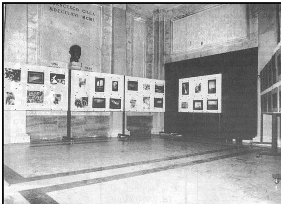
L'esposizione presso il ridotto del Teatro Comunale F.sco Cilea di Reggio Calabria