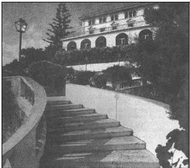
Il Grand Hotel San Michele dove si è tenuto il workshop