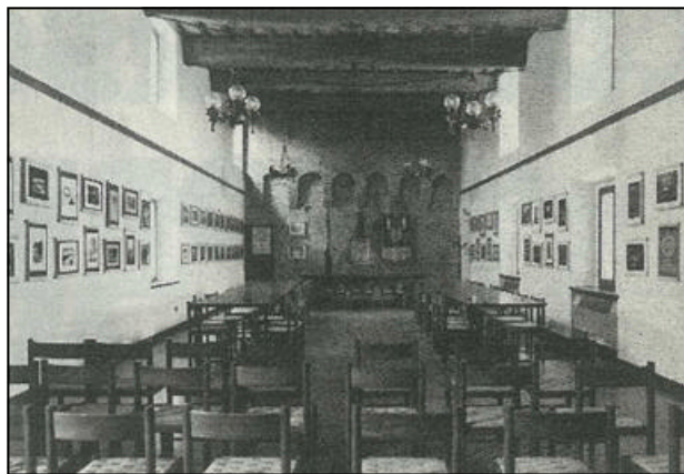
Un aspetto della mostra