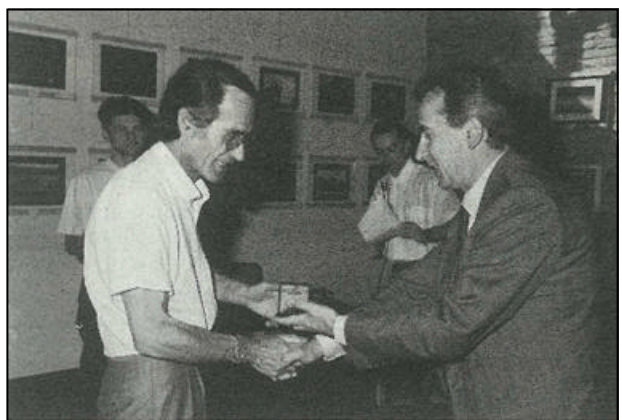
Un momento della premiazione