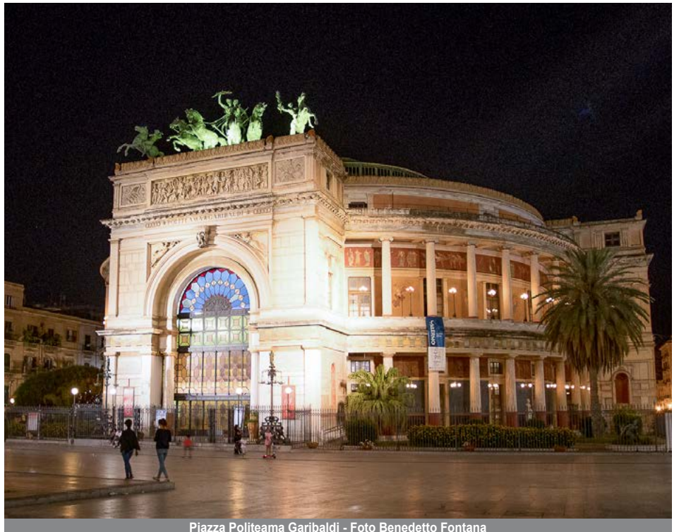
Piazza Politeama Garibaldi

La Uif, segreteria regionale della Sicilia e Siciliando Style, associazione culturale di oltre 57.000 iscritti, hanno organizzato una passeggiata fotografica notturna per raccogliere una serie di immagini che evidenzino ancor di più le bellezze di Palermo, città capitale italiana della cultura per l'anno 2018, da meglio conoscere e far conoscere a tutto il mondo rinnovando nel contempo l'amore per la fotografia, l'arte e la buona compagnia. L'incontro si è svolto venerdì 29 giugno 2018 a Piazza Ruggero Settimo (davanti l'ingresso del Teatro Politeama) alle 21.45 per la registrazione dei partecipanti e successivo inizio del percorso fotografico lungo l'itinerario di Piazza Verdi (Teatro Massimo), Piazza Vigliena (4 Canti), Spiazzo antistante la Cattedrale, Piazza Pretoria, Discesa dei Giudici, Piazza Sant'Anna, Fontana del Garraffello al Mercato della Vucciria, Porta Carbone (La Cala). Il gruppo, inizialmente consistente, si è man mano assottigliato con il passare delle ore e pochi tenaci hanno completato la passeggiata alle tre di notte soddisfatti della piacevole iniziativa. (Benedetto Fontana)