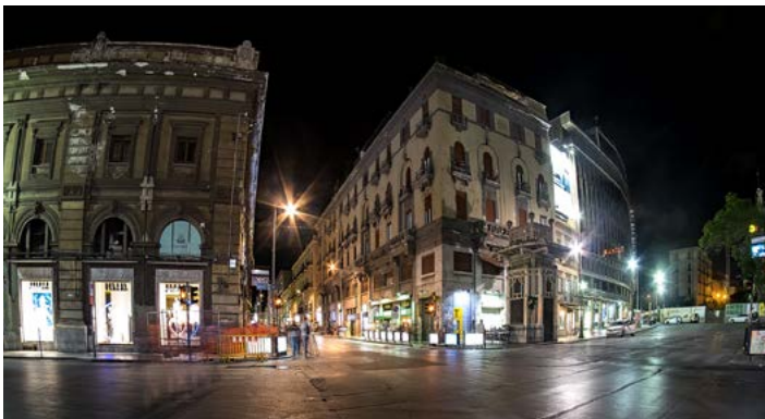
Via Ruggero Settimo