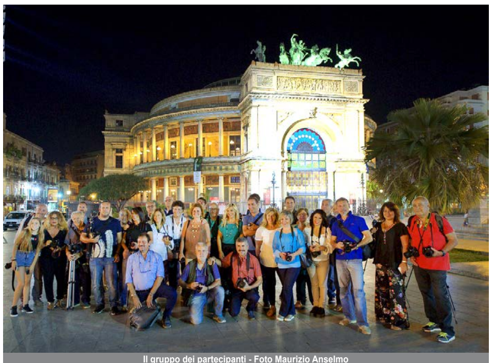
Il gruppo dei partecipanti