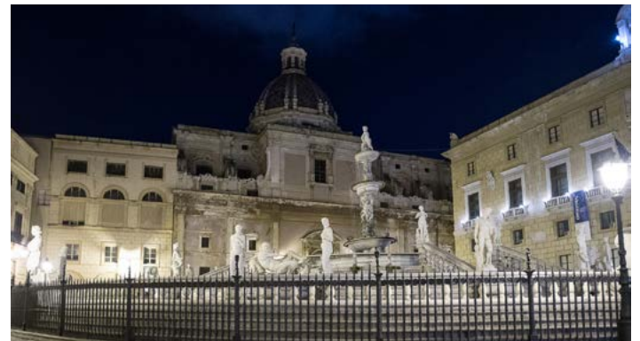
Fontana di Piazza Pretoria - Foto Benedetto Fontana