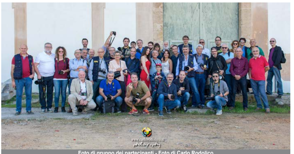
Foto di gruppo dei partecipanti