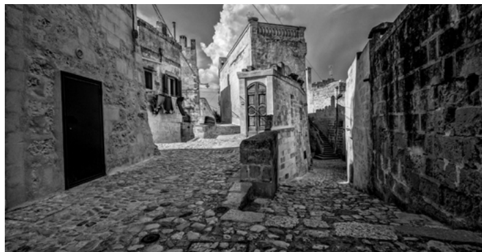
Primo premio BN Bartolomeo La Gioiaq