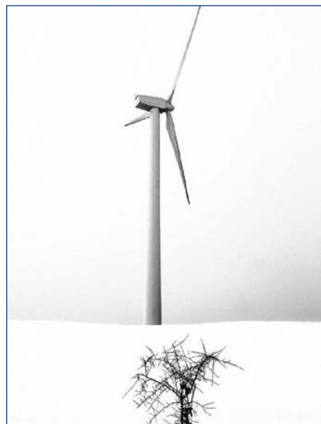
3° premio tema obbligato Carmine Brasiliano