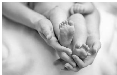
2° premio tema libero Giovanni Artale