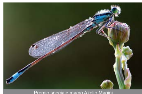
Premio speciale macro Azelio Magini