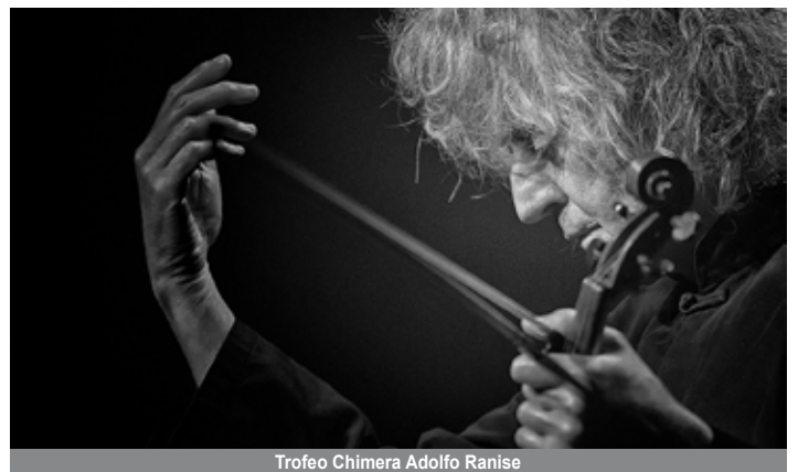
Trofeo Chimera Adolfo Ranise