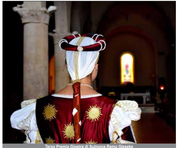
Terzo Premio Giostra di Sulmona Remo Gieseke