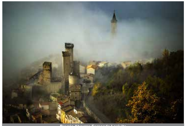
Premio Abruzzo Fernando Lacivita