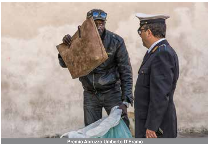
Premio Abruzzo Umberto D'Eramo