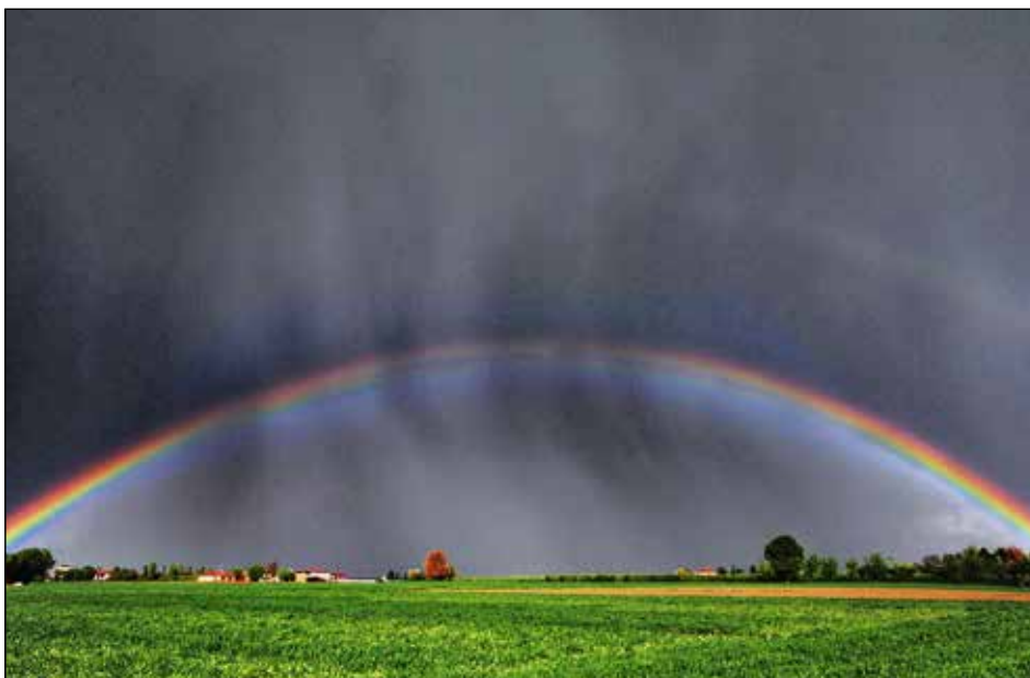
Secondo Premio Medardo Alberghini