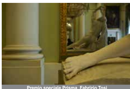
Premio speciale Prisma Fabrizio Tosi