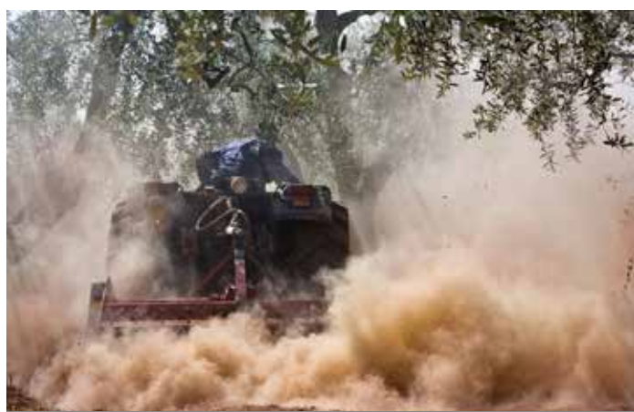
2° premio tema obbligato Nicola Colapinto