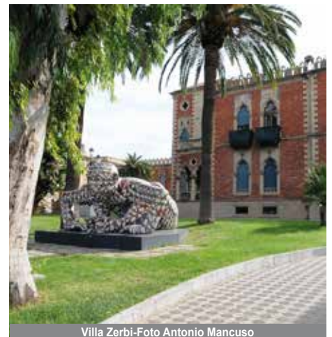
Villa Zerbi