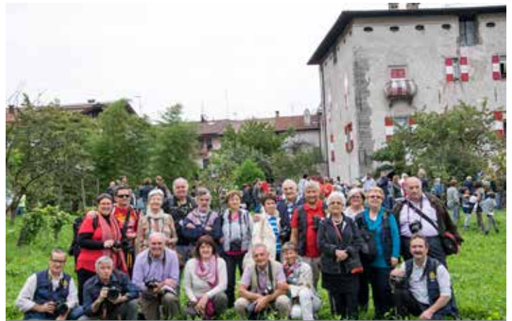
Il gruppo UIF del Trentino