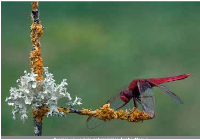
Premio giuria foto naturalistica Azelio Magini