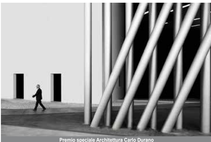
Premio speciale Architettura Carlo Durano