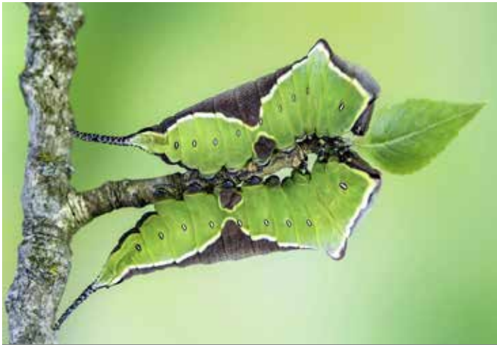
Premio unico cat.C foto naturalistica Alessio Cipollini