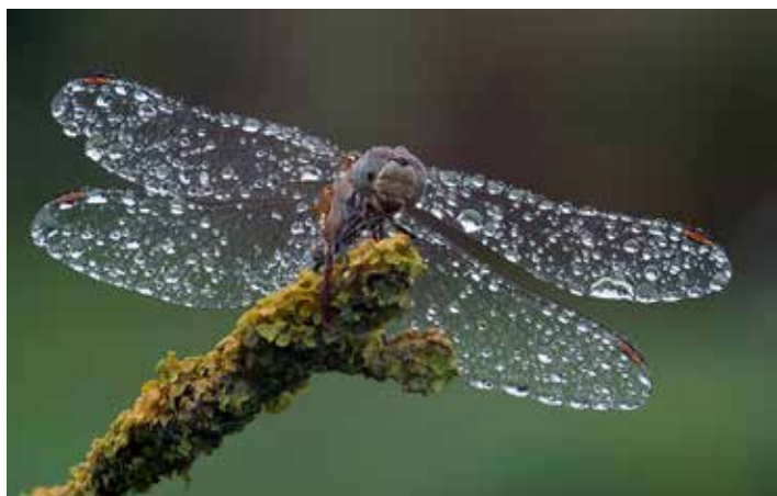
2° premio tema libero Azelio Magini

Al concorso hanno partecipato 37 autori per complessiva 296 opere presentate. Oltre le foto premiate e segnalate sono state ammesse 33 opere nel Tema Obbligato “Fotografiamo l’iperattività” e 27 nel tema libero.