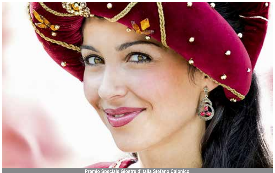
Premio Speciale Giostre d'Italia Stefano Calonico