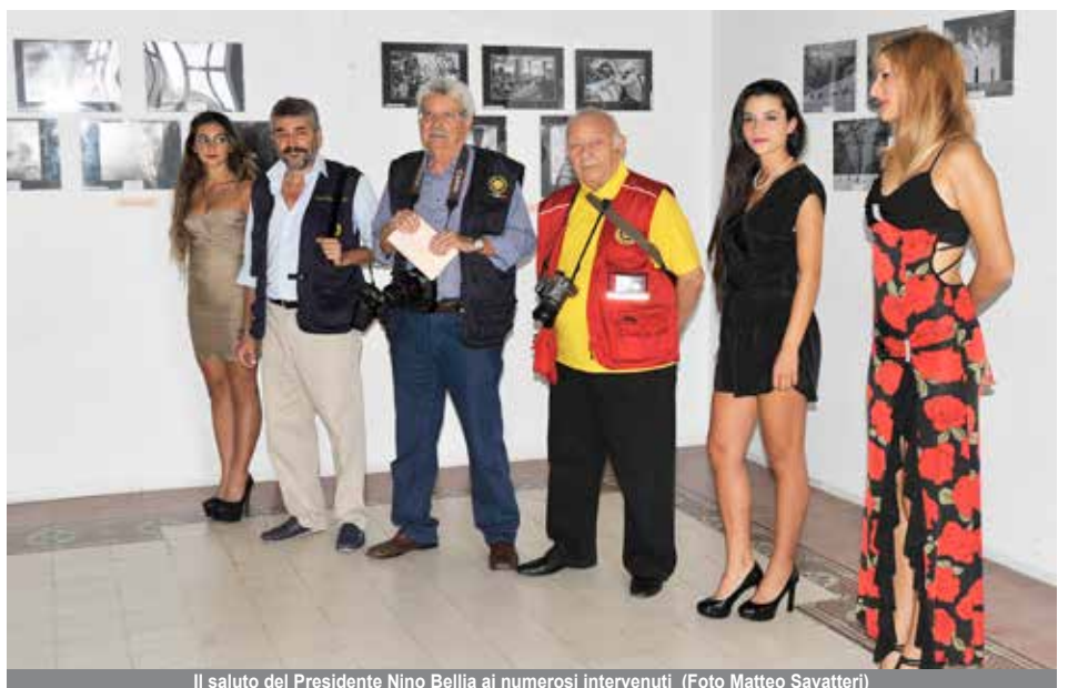
Il saluto del Presidente Nino Bellia ai numerosi intervenuti