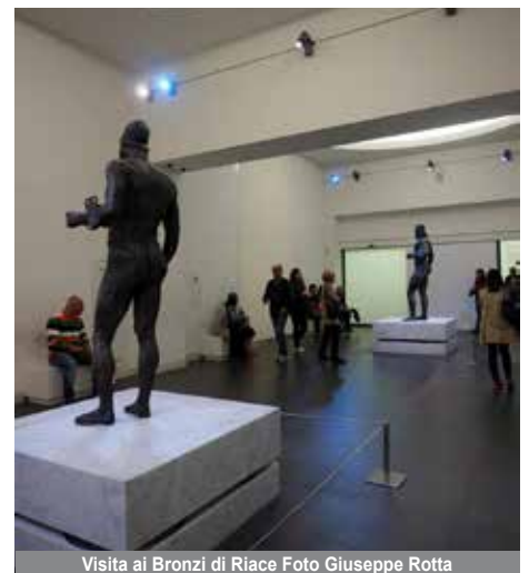
Visita ai Bronzi di Riace