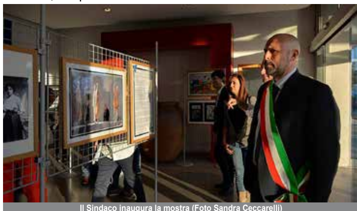
Il Sindaco inaugura la mostra