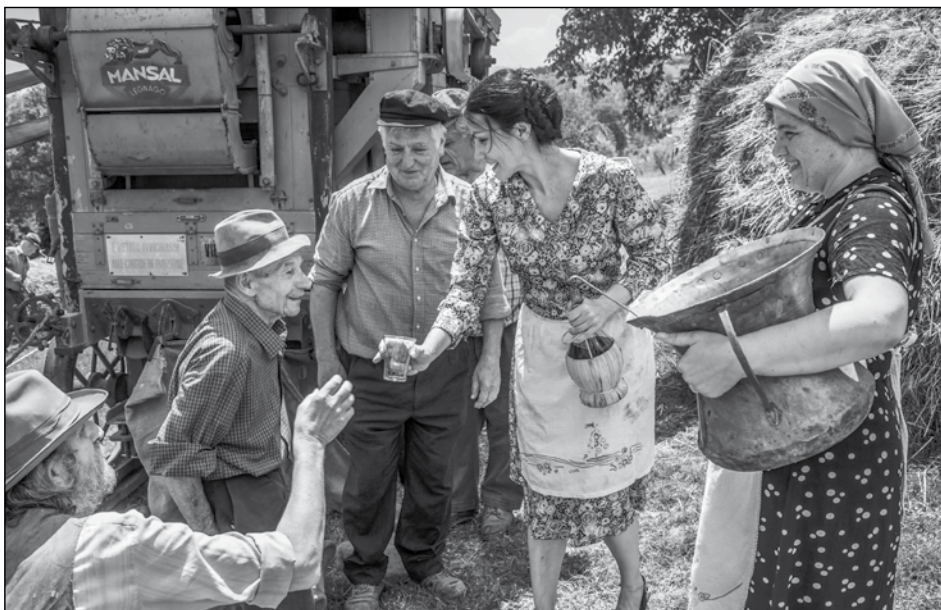
Primo Premio Sergiacomo Terigio