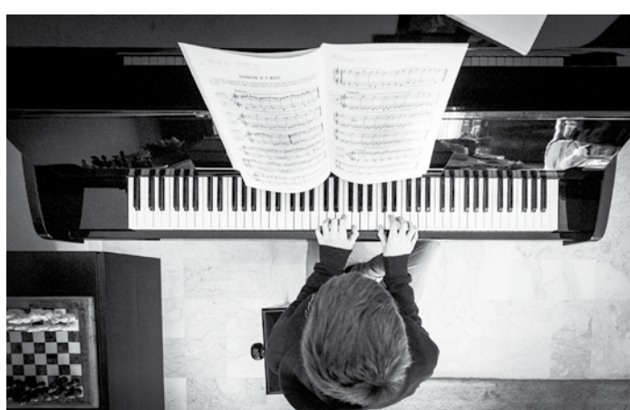
3° premio tema libero Giovanni Sarrocco