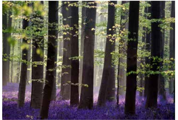
Premio unico cat.D foto naturalistica Marina Brancaccio