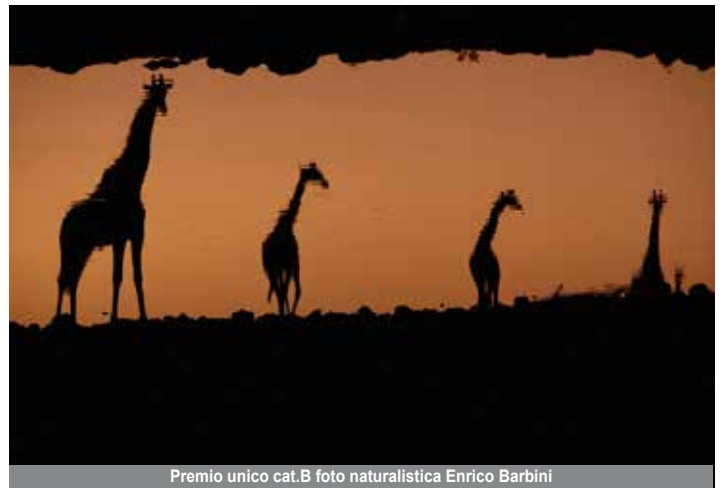
Premio unico cat.B foto naturalistica Enrico Barbini