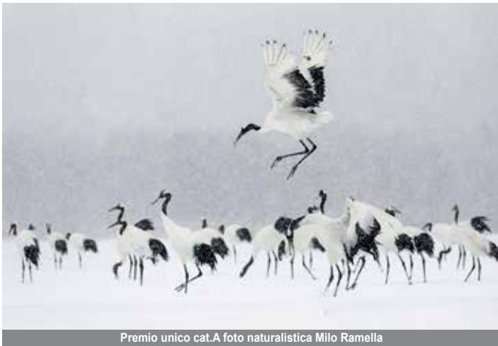
Premio unico cat.A foto naturalistica Miilo Ramella