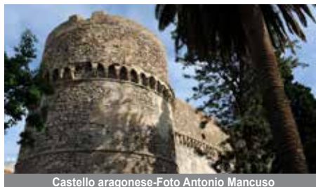
Castello aragonese