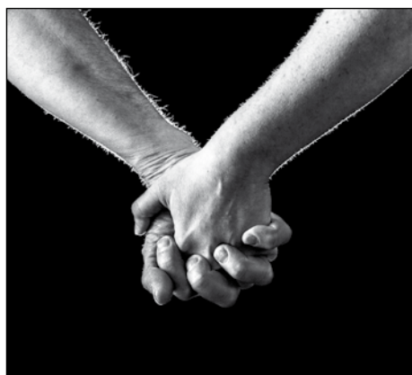
Premio Speciale Massimo Robiglio