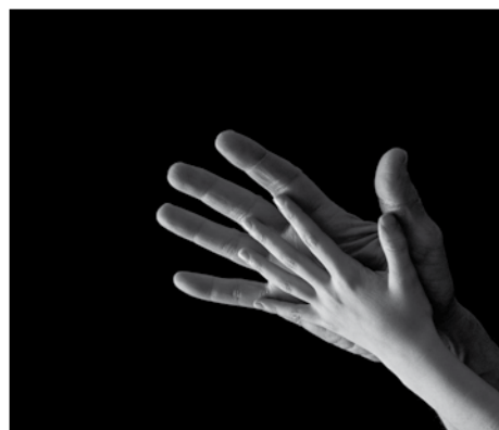
Premio Speciale Massimo Robiglio