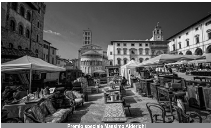
Premio speciale Massimo Alderighi