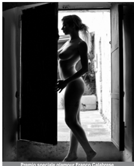
Premio speciale glamour Franco Calabrese