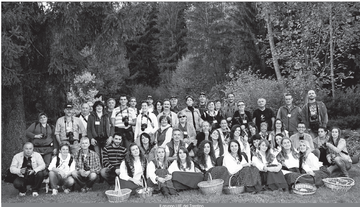
Il gruppo UIF del Trentino

della giornata in una stampa formato 30x45 con la quale cercheremo di proporre una mostra fotografica ad Arco (TN) nel periodo luglio/agosto. • Nel corso dell'anno vorremmo sviluppare un tema fotografico (In Trentino ... sulle tracce dell'uomo") che, nella prima quindicina di settembre, sfocerà in una mostra fotografica allestita nel sito archeologico di Piazza Lodron a Trento. Mi piacerebbe fin d'ora conoscere i soci che aderiranno a questo progetto al fine di capire quante immagini gli stessi potranno presentare ecc.....per questo aspetto vostre nuove. • Per realizzare questo tema si potrebbe anche organizzare una giornata di fotografia e visitare i siti archeologici di S. Martino (comune di Comano Terme) e le palafitte nel comune di Fivè che sono dichiarate patrimonio dell'Unesco. Ritengo che per questa iniziativa saranno particolarmente interessati coloro che parteciperanno al progetto ma comunque tutti i soci saranno invitati. • Si potrebbe ripetere la mostra nel comune di Pomarolo (TN) ....mostra che è stata gradita sia dalla locale amministrazione comunale sia dalla popolazione. • Per finire in bellezza la nostra attività aderiremo poi alla giornata Nazionale del Fotoamatore che organizzerà la UIF Nazionale e che l'associazione Ima.g.e. delle Giudicarie Esteriori ha già messo nel suo calendario organizzativo per il 2013. Verrà realizzata nel comune di Comano Terme con un programma veramente interessante che sarà divulgato a suo tempo.