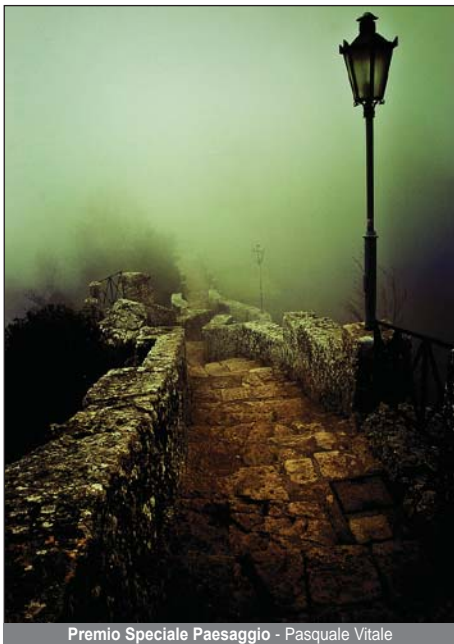
Premio Speciale Paesaggio - Pasquale Vitale