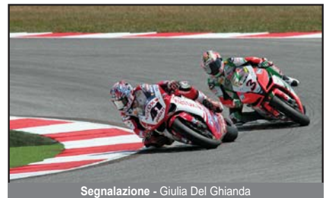
Segnalazione - Giulia Del Ghianda