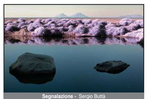
Segnalazione - Sergio Buttà