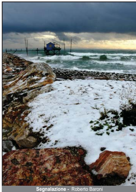
Segnalazione - Roberto Baroni