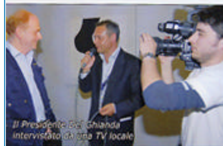
Il Presidente Del Ghianda intervistato da una TV locale