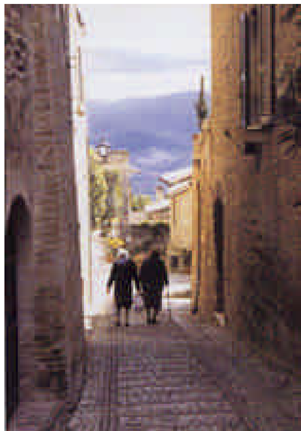
"Fatta la spesa"

attività ripetitive negli anni, ma non per questo secondarie ad altre, che ogni anno, vengono realizzate per conto del comune o di altre associazioni presenti nel territorio Monturanese; le attività costanti sono: mostra fotografica collettiva dei soci del circolo nel mese di maggio per la festa del Santo Patrono, mostra fotografica collettiva dei soci del circolo tutti i venerdì di luglio ed il primo di agosto durante il mercatino della calzatura, corso base di fotografia completamente gratuito, tenuto dai soci del circolo per i numerosi appassionati e un corso avanzato di fotografia, tenuto da professionisti per i soci del circolo, sù