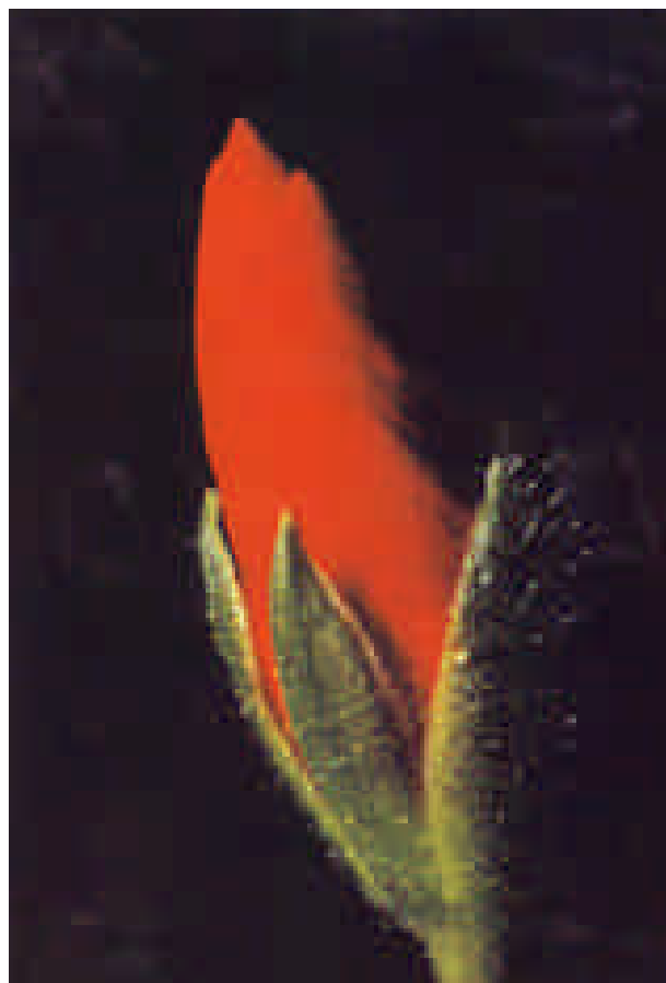
"Macro 1"