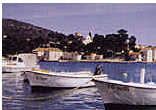
"Fatta la spesa"

argomenti e tecniche fotografiche e di camera oscura, che i soci di anno in anno decidono di approfondire. Dalla sua nascita, il circolo, oltre a quello soprallencato, ha sino ad ora realizzato le seguenti attività: maggio 2000 mostra collettiva (ancor prima della nascita del circolo), giugno 2001 collaborazione con il comune e la provincia per allestire ed organizzare una mostra fotografica dello scomparso Mario Giacomelli, e realizzazione del calendario comunale 2002, giugno 2002 collettiva a Macerata, Ottobre 2002 mostra del fotografo Fabrianese Giampiero Stefanelli, Febbraio 2003 collettiva a Foce di Montemonaco (A.P.) per il concorso "una foto per la montagna" (dove i soci del circolo si sono aggiudicati i primi 6 premi! cioè tutto), Maggio 2003 mostra del socio UIF Enzo Corvino, Settembre 2003 i soci UIF dell'EffettoLuce e del fotoclub "Iride" insieme a qualche altro socio hanno aiutato il segretario provinciale Germano Paoloni nell'organizzazione di Cartacanta, Ottobre 2003 inizia per conto del comune e del ser-