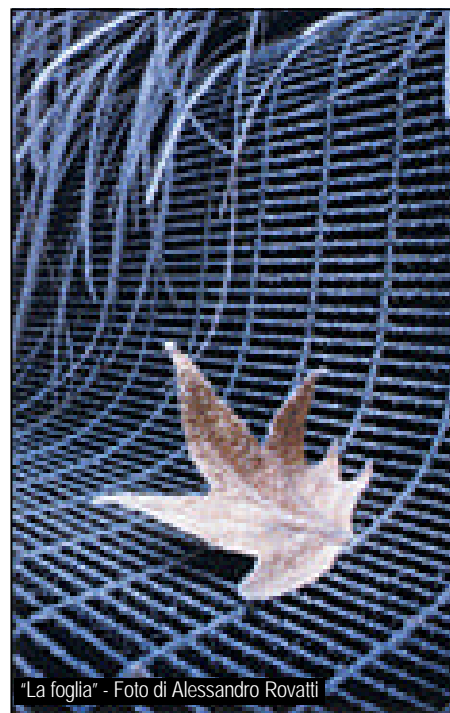
"La foglia"

Premio speciale Giuria: Martino Giacomo con l'opera "I portatori". Le fotografie premiate e ammesse sono state esposte nella Sala Consiliare del comune di Tiriolo dal 18 al 21 dicembre u.s.