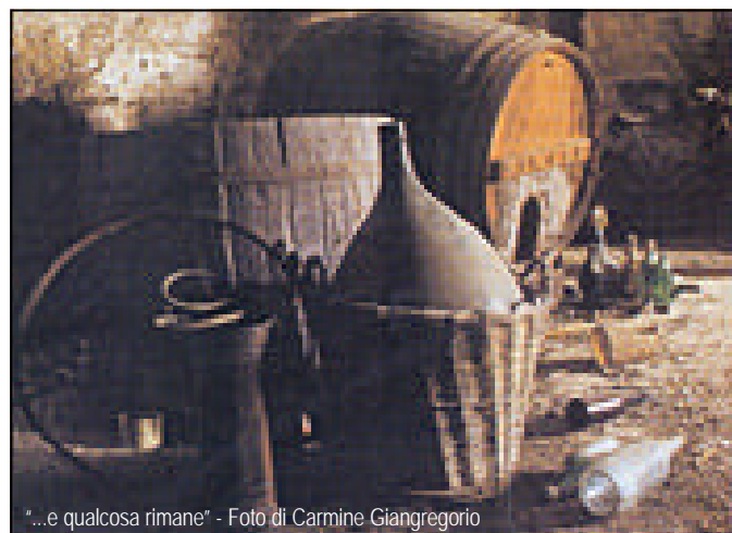
"...e qualcosa rimane"