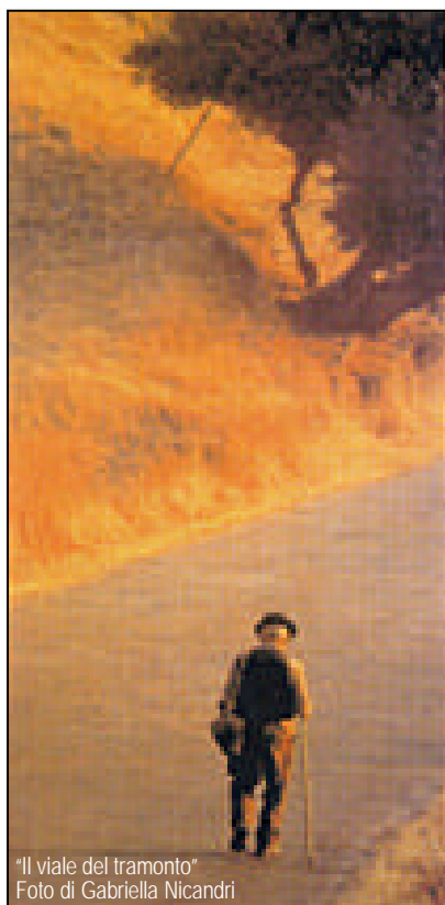
"Il viale del tramonto"