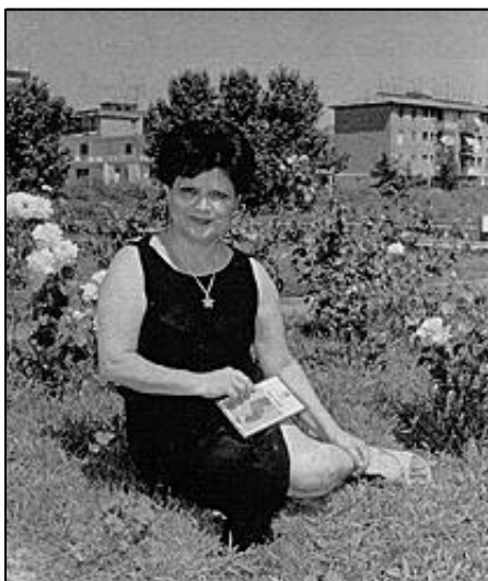
Copertina del libro