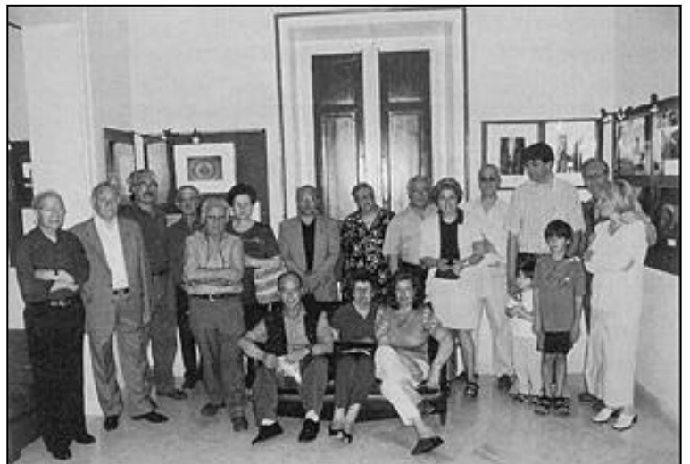
I soci UIF nella sede dell'Associazione "Arte Immagine"