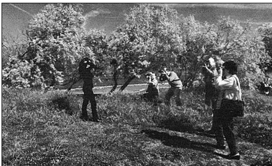
Gita a Baratti