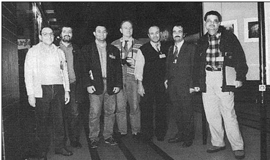
In visita alla mostra 3° circuito UIF 1996