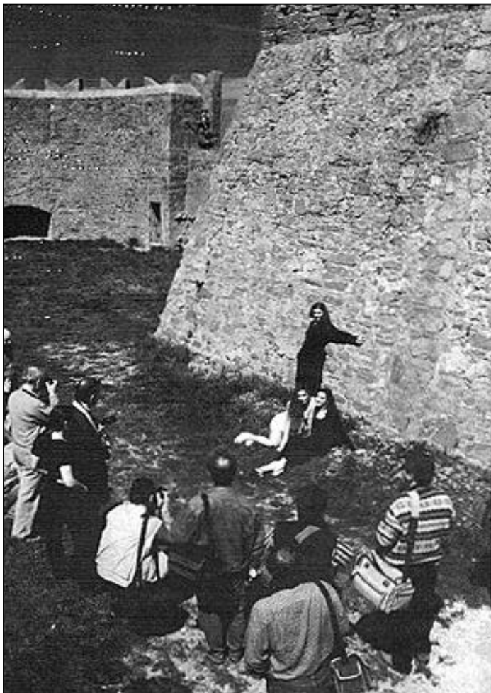
Gita con modelle al Castello di Populonia

C'era l'occorrente scenografia per ogni sorta di prospettiva ritrattistica, cioè pensata tutta acqua e sapone, l'immaginario sui volti, gli occhi, le labbra senza quant'altro di ammiccante, si poteva riempire, volendo, parecchie pagine del book fotografico.