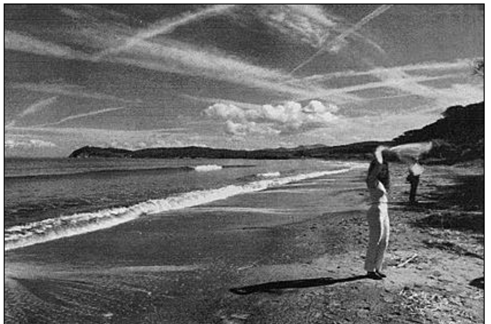
Modelle in spiaggia a Baratti