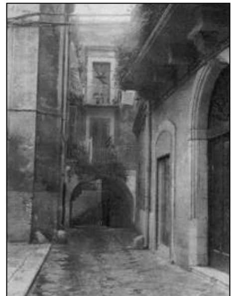
Premio miglio paesaggio "Vicolo di bari vecchia"

Alla fine della premiazione la Performance di Bari si è esibita in un divertente cabaret.