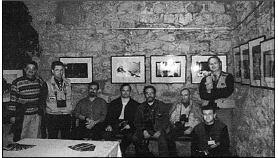
In visita alla Mostra di "Franco Fontana"

Dopo cena, sempre presso la sala Club 41, dia proiezione che ancora ci soddisfa e ci