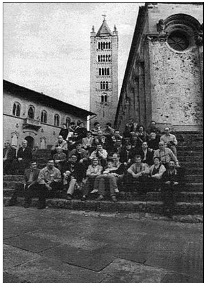
Foto di gruppo a Massa Marittima