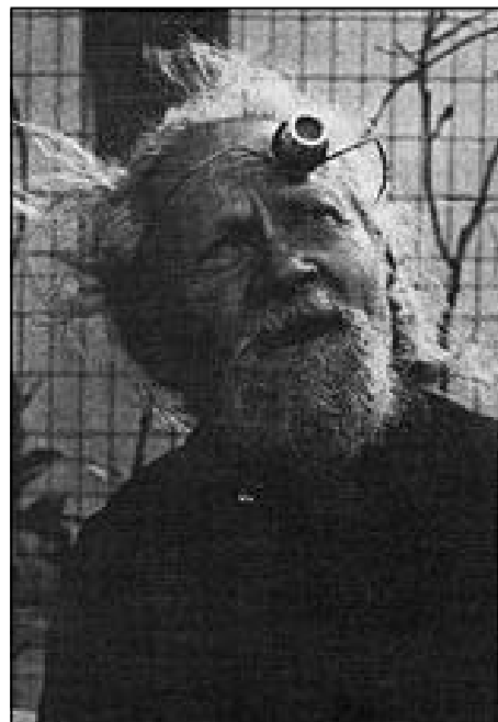
"L'orologiaio"